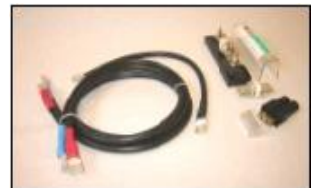
Batterikabel og sikring