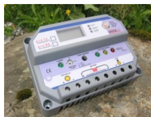
ENERGITEK PRO 15 solcelleregulator