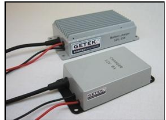
STUDER MBC 0612/1512 ladere