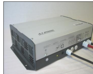
STUDER AJ-2400-24 sinus vekselretter