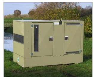
ENERGITEK spesial aggregater