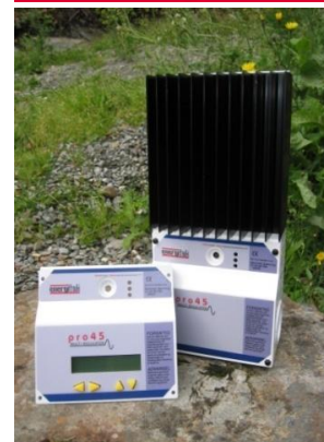
ENERGITEK PRO 45