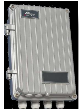
NYHET ! Studer XTS