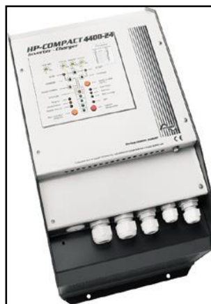
STUDER HPC 4400-24