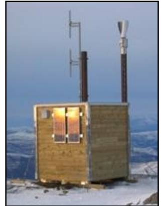
GETEK Ekstrem ASE/6