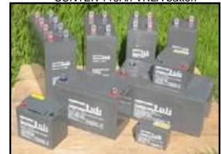
SUNTEK 12V og 2V batterier