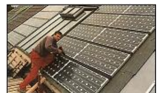
Montering av solcellehus på Hamar