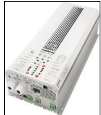
STUDER XPC 2200-24