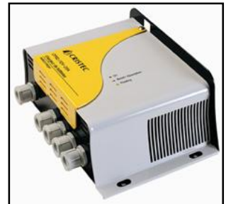
CRISTEC CPS 3/24-50 batterilader