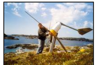
Montering av vindkraftverk på Hitra