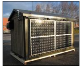
GETEK Maxi ASE/SD16