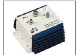
GETEK MBI skillediode