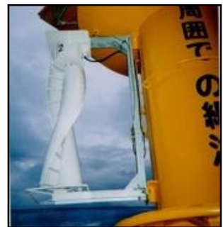
GETEK WS 030A