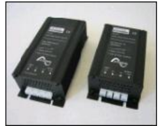
GETEK MDC DC/DC omformer