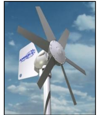
AMPAIR Pacific 100